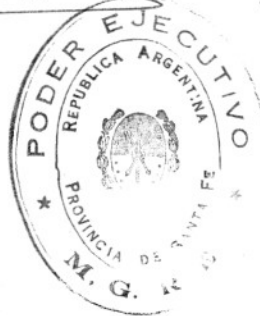
HERMES JUAN BINNER GOBERNADOR DE SANTA FE